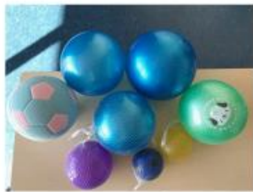
100円均一ショップで入手できるソフトボール (80-130 g)

ルに触れることから始まり、負荷の軽い状況から徐々に強くボールを飛ばすことができるように技術を習得し、同時に体幹や首回りの筋力を鍛えていくことが大切である。