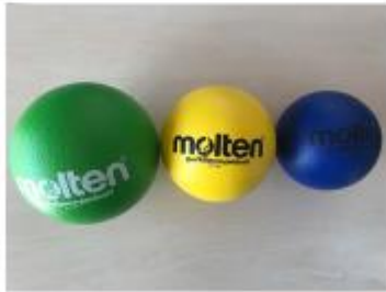
小学校体育サポートで推奨のスポンジボール (200-230 g) および新聞ボール