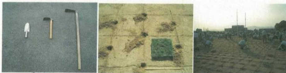
②移植鍬、小鍬(地面が硬ければ唐鍬)で深さ5cm程度の穴を掘る