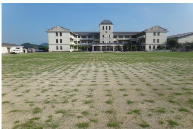
植付け 1 カ月後の模様 撮影日：2012 年 6 月 23 日