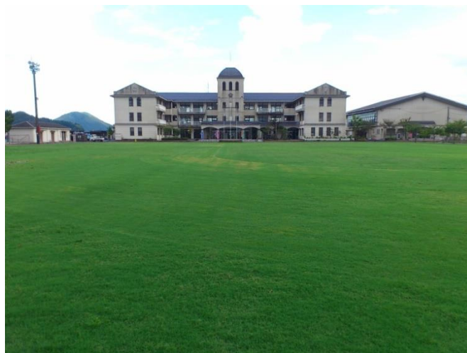
移植後約 3 カ月の芝生の模様 撮影日：2012 年 9 月 20 日