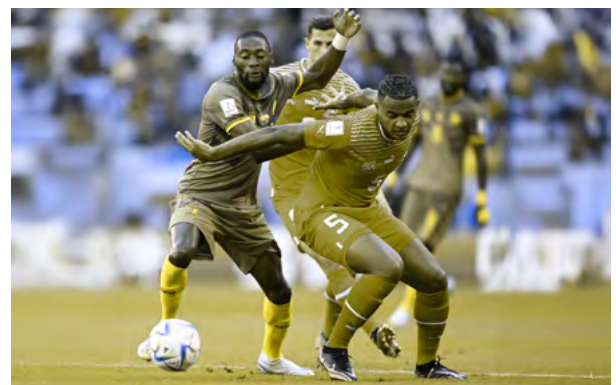
同じ写真で色覚障害のシミュレーションを施したものの。対戦相手のプレーヤーを区別するのが非常に困難です。