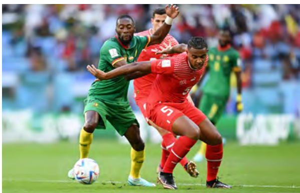
カメルーン(緑のユニフォーム)とスイス(赤のユニフォーム)の試合中の通常の見え方。

Colour Blind Awareness は、色覚障害とサッカーへの影響に関する追加の研修を提供しています。いくつかのウェブサイト、例えば WebAIM: Contrast Checker では、色覚障害のある人には写真やコンテンツがどのように見えるかを可視化できます。